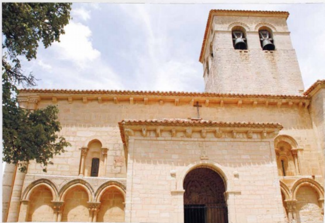
Iglesia de Moradillo de Sedano