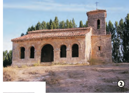
Ermita Santa Cecilia s. IX

1 En una estrecha angostura del arroyo de los Molinos, entre grandes farallones rocosos, se encuentra El Churrión, una pequeña cascada que en invierno tiene bastante agua, pero que en verano llega a secarse por la naturaleza del terreno, calizo, que filtra gran parte del agua. Además, en uno de los cantiles se pueden observar restos de un antiguo acueducto.