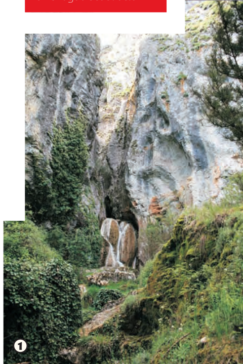
Cascada en El Churrión

El camino de Carremolino se adentra en la garganta que ha ido modelando el río Matavejas, dando lugar a peñas y cantiles rocosos sobre los que nidifican gran cantidad de aves rapaces. El bosque de la ribera flanquea las dos orillas del río y junto a sus márgenes discurre la ruta hasta alcanzar un viejo molino.