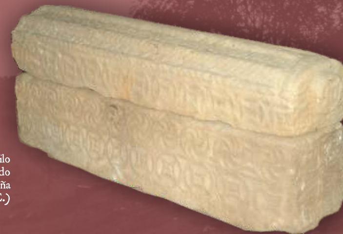
Sarcófago de estilo asturiano conservado en San Fructuoso de Lamiña (mediados del siglo IX d.C.)

La epopeya de los Foramontanos, recogida por las fuentes históricas de la época, y por historiadores y literatos de todos los tiempos, constituye un recurso histórico de estas comarcas que desborda -en ambos sentidos- la Cornisa Cantábrica, conectando el litoral cantábrico con las amplias llanuras de la Meseta Norte Peninsular. La misma nos habla de un viaje a través de una ruta que unía Malacoria (seguramente la actual Mazcuerras) con la Brannia Osaria (Brañosera), lugar este último donde, en el año 824 de nuestra era, un grupo de foramontanos recibiría la Primera Carta Puebla de España, de manos del Conde Munio Nuñez, que daría lugar al primer ayuntamiento de España.